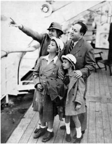
1936: Erich Wolfgang Korngold arriveert met zijn gezin in New York.